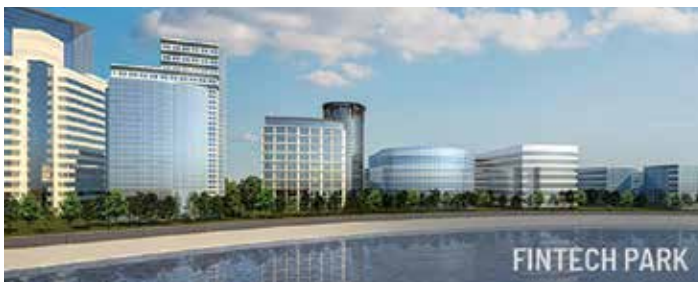
U Jaipuru se planira izgraditi integrirani Fintech Park, koji će se prostirati na 37 hektara s vrhunskim, najmodernijim poslovnim prostorima za IT ulagače u financijskom segmentu. Nalazit će se samo dva kilometra od zračne luke Jaipur

Potencijal za solarnu proizvodnju Rajasthana procijenjen je na 142 GW. Zbog toga Vlada savezne države Rajasthana planira sustavno koristiti solarnu energiju u ukupnoj proizvodnji energije kako bi postigla ambiciozan cilj od 30 GW kapaciteta do 2024. – 2025. koji će transformirati energetske okvir te