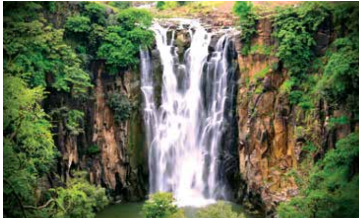
Madhya Pradesh ima jedinstvena turistička mjesta koja uključuju povijesne palače, utvrde i geološka čuda te prekrasne krajolike poput slapova Patalpani

Upravo je Madhya Pradesh glavno farmaceutsko središte u zemlji u kojemu su smještene ključne domaće i međunarodne tvrtke u tom