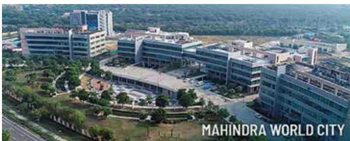
Mahindra World City u Jaipuru, najveći IT SEZ u sjevernoj Indiji (prostire se na 750 hektara), nudi izvrsnu infrastrukturu za IT i ITes tvrtke

savezne države i Indije. Inicijativa ima za cilj dalekosežne intervencije na svim razinama proizvodne piramide i u cijelom lancu opskrbe, uključujući sve dionike, imajući na umu i otvaranje novih radnih mjesta za mlade.