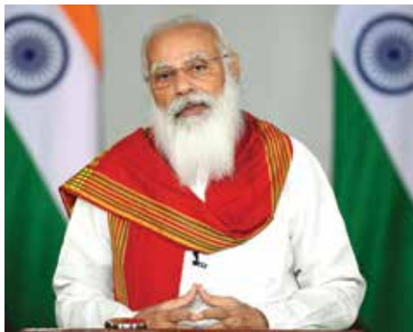
Gift City nije samo premisa. Predstavlja obećanje Indije... Gift City je ulaz u globalni fintech svijet. IFSC u Gift Cityju rođen je iz vizije da će financije u kombinaciji s tehnologijom biti važan dio budućeg razvoja Indije, rekao je premijer Narendra Modi

Gujarat je lider u industrijskim sektorima kao što su kemijski, petrokemijski, mljekarski, farmaceutski, proizvodnja cementa, keramike, dragulja, nakita i tekstila te inženjering. Industrijski sektor sastoji se od više od 800 velikih kompanija i više od 450.000 malih, srednjih i mikropoduzeća. Država ima više od 3300 farmaceutskih proizvodnih jedinica, koje su prošle godine pridonijele s 30 – 35 posto prometu indijskoga farmaceutskog sektora i oko 28 posto indijskom izvozu farmaceut-