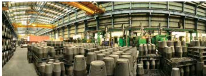
HEG-ova najveća integrirana tvornica grafita na svijetu nalazi se u Mandideepu blizu Bhopala. Godišnji je kapacitet proizvodnje 80.000 metričkih tona elektroda klase UHP-a (ultravisoke snage) i ima namjensku postavu za istraživanje i razvoj ugljika i grafita

sektoru. Više od 100.000 ljudi u toj državi zaposleno je u farmaceutskom sektoru. No Madhya Pradesh veliku pozornost posvećuje i inovacijama u razvoju farmaceutike: ima osam odjela za razvitak lijekova u obliku kapsula ili tableta, 31 odjel za razvoj novih lijekovitih tvari te četiri velika parenteralna odjela usklađena s certifikacijom dobre proizvodne prakse