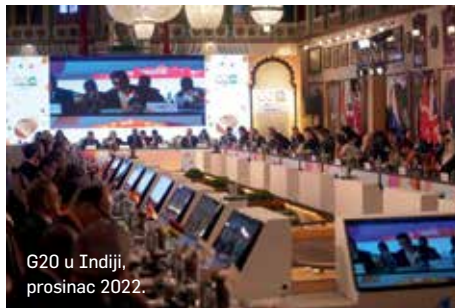
G20 u Indiji, prosinac 2022.

– Indija je mikrokozmos u kojem živi jedna šestina čovječanstva i koji okuplja mnogo raznolikih jezika, religija, običaja i vjerovanja. S najstarijom poznatom tradicijom kolektivnog odlučivanja Indija pridonosi temeljnom DNK-u demokracije. Danas