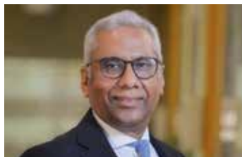
piše DEEPAK BAGLA ,

Od 2018. više od tisuću proizvoda iz 765 indijskih okruga sada je dio inicijative 'Jedan okrug, jedan proizvod', ekosustava koji povezuje najbolje indijske obrtnike i autohtone proizvođače s kupcima iz svih krajeva svijeta, ostvarujući pogodnosti u nabavi i marketingu